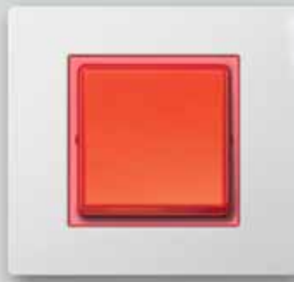
27play con pieza intermedia